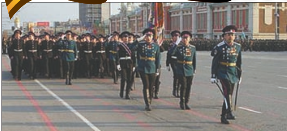
Жители Новосибирска бурными аплодисментами встретили прохождение на параде кадетского коорпуса, возглавляемого генералом КК Николаем Вальдемаровичем Бордюгом