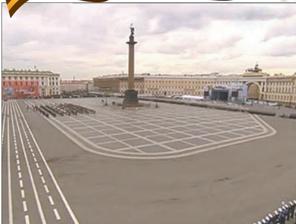
ДВОРЦОВАЯ ПЛОЩАДЬ готова к параду