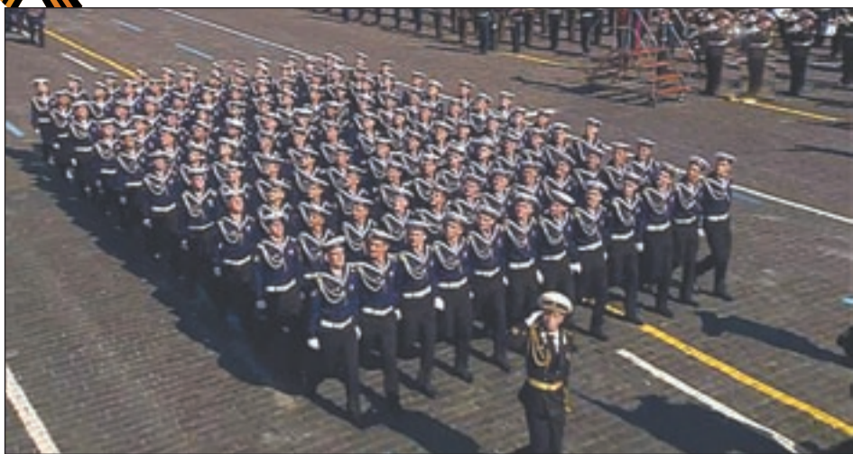
Нахимовцы Военно-морского нахимовского училища