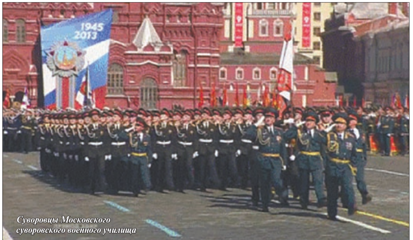
Суворовцы Московского суворовского военного училища