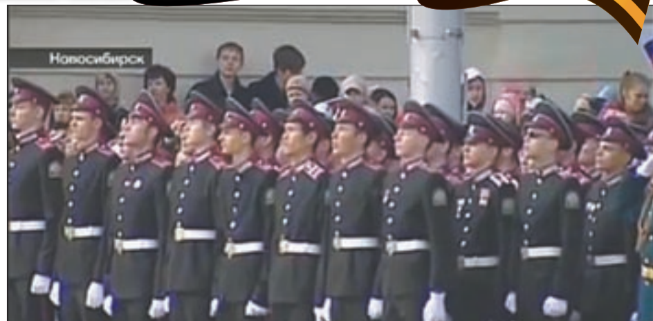
Обратите внимание: военная форма новосибирских кадет значительно ближе к традиционной русской военной форме