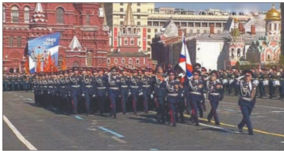
Кадеты Аксайского казачьего кадетского корпуса