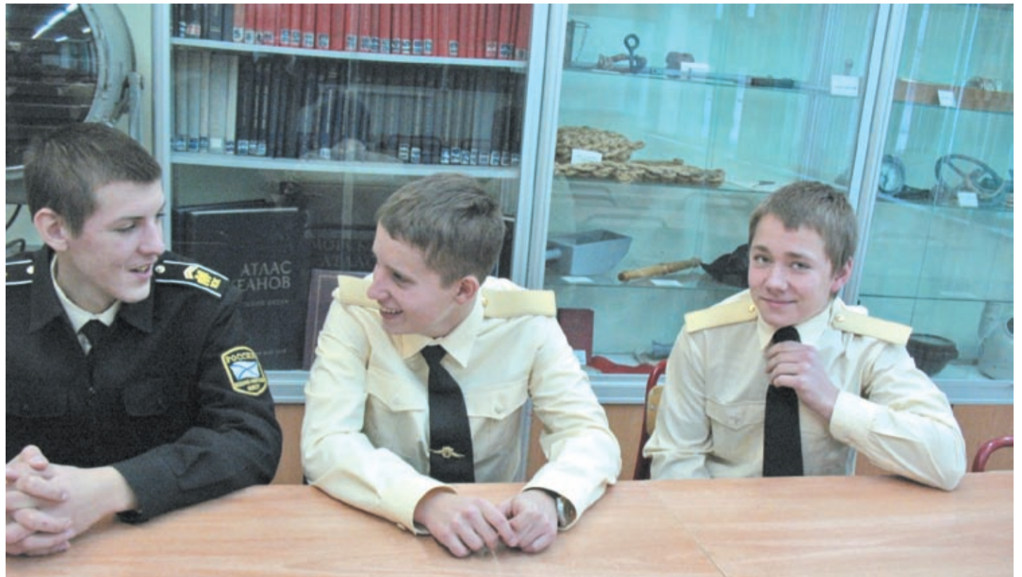
Из восьмого класса перехожу к младшим кадетам на урок по военно-морской подготовке. С каким удовольствием мальчишки занимаются изучением якоря, морских узлов, семафора...