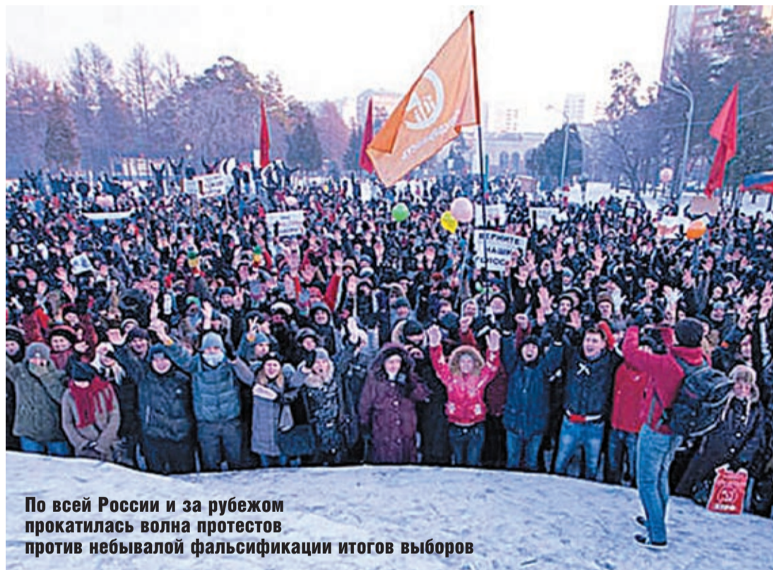
По всей России и за рубежом прокатилась волна протестов против небывалой фальсификации итогов выборов

«Правое дело» и «Патриоты России» собрали менее 7% голосов и не получили депутатских мандатов.