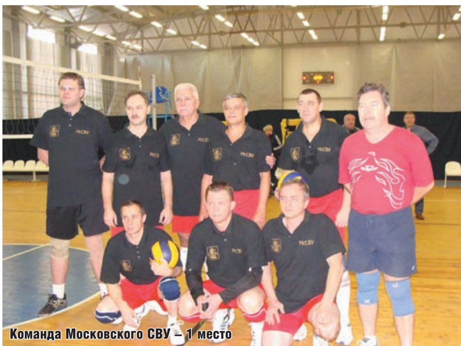
Команда Московского СВУ - 1 место