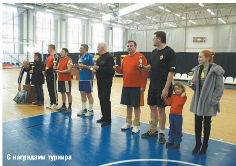
С наградами турнира