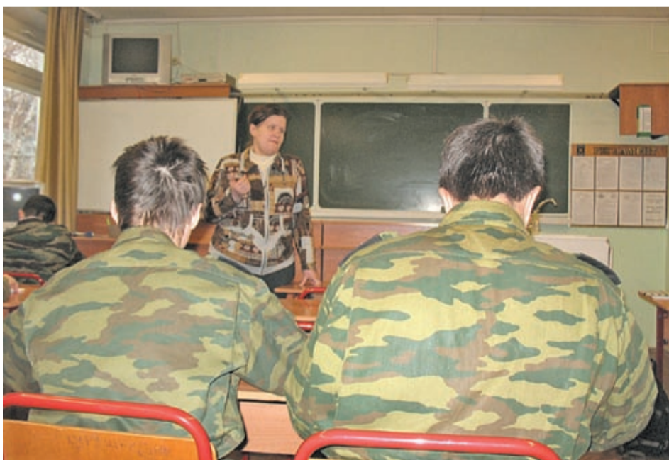
Идет урок физики. Преподаватель предлагает рассмотреть процесс кипения. Поднимается лес рук, кадеты, один за другим, отвечают на вопрос. Отвечают правильно. Сразу видно, что учитель и ученики хорошо понимают друг друга. Все подробно записывают материалы урока. «Удельная теплота парообразования. Конденсация».