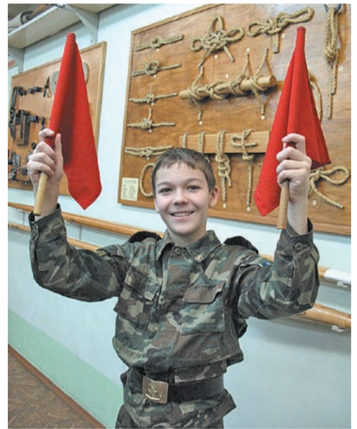
Посмотрите на веселую улыбку этого кадета! Он спросил меня, что это значит? А я не знал, что это значит! Оказывается это сразу две буквы - Ъ и Ь!