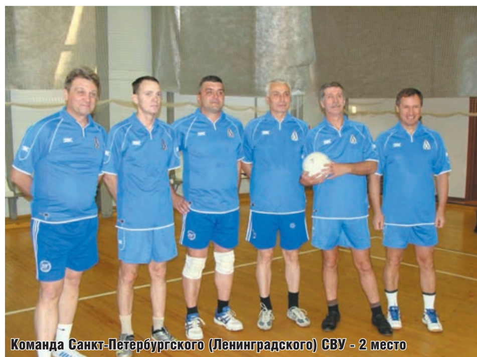
Команда Санкт-Петербургского (Ленинградского) СВУ - 2 место