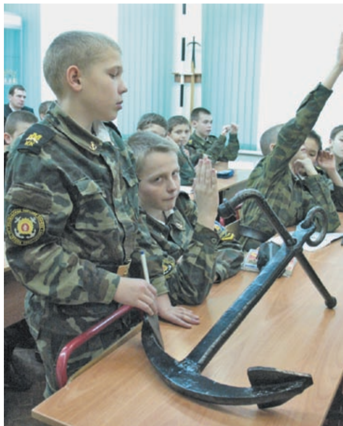
На уроке по морской подготовке. Оказывается, все эти кадеты могут столько интересного рассказать о якоря, что на моем диктофоне не хватит места для такой записи!

«Я – москвичка, учусь здесь уже пятый год, в следующем году - выпуск. Я надеюсь поступить в академию ФСБ. У нас девочек меньше чем мальчиков, но мы совсем не обижаемся на наших гардемарин. Мне интересна военно-морская подготовка. У нас хороший классный руководитель – учитель алгебры, хороший преподаватель физики».