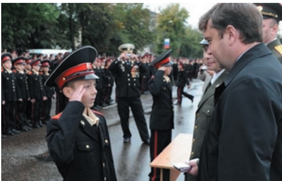
Губернатор А.В.Шевелев в Тверском СВУ