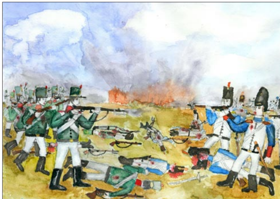
1812 год — Бородино. Рис. Василий Чередыко г.Томск.

Учебным заведениям на конкурсе не определялись первые места, только личное первенство конкурсантов. Однако, нельзя не отметить, что самые лучшие работы из военных кадетских образовательных учреждений представили Санкт-Петербургское суворовское военное училище и Суворовское военное училище МВД, Ставропольское и Оренбургское президентские кадетские училища, Кронштадтский морской кадетский корпус, Санкт-Петербургский кадетский корпус, Нахимовское военно-морское училище, Пансион