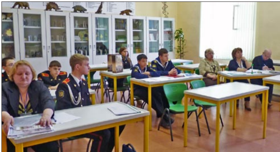
На секции «М. И. Кутузов. Факты и мифы»

Тема конференции: «Отечественная война 1812 года глазами современной молодежи»