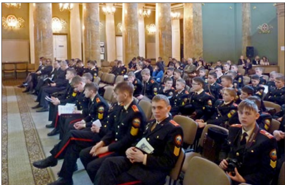
Участники межрегиональной конференции

Профессиональное и общественное жюри оценили выступления участников конференции и определили места среди них. Каждый получил на память сертификат участника, а также специальный блокнот и буклет о Санкт-Петербургском суворовском военном училище.