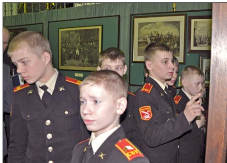
Осмотр выставки суворовцами Санкт-Петербургского СВУ