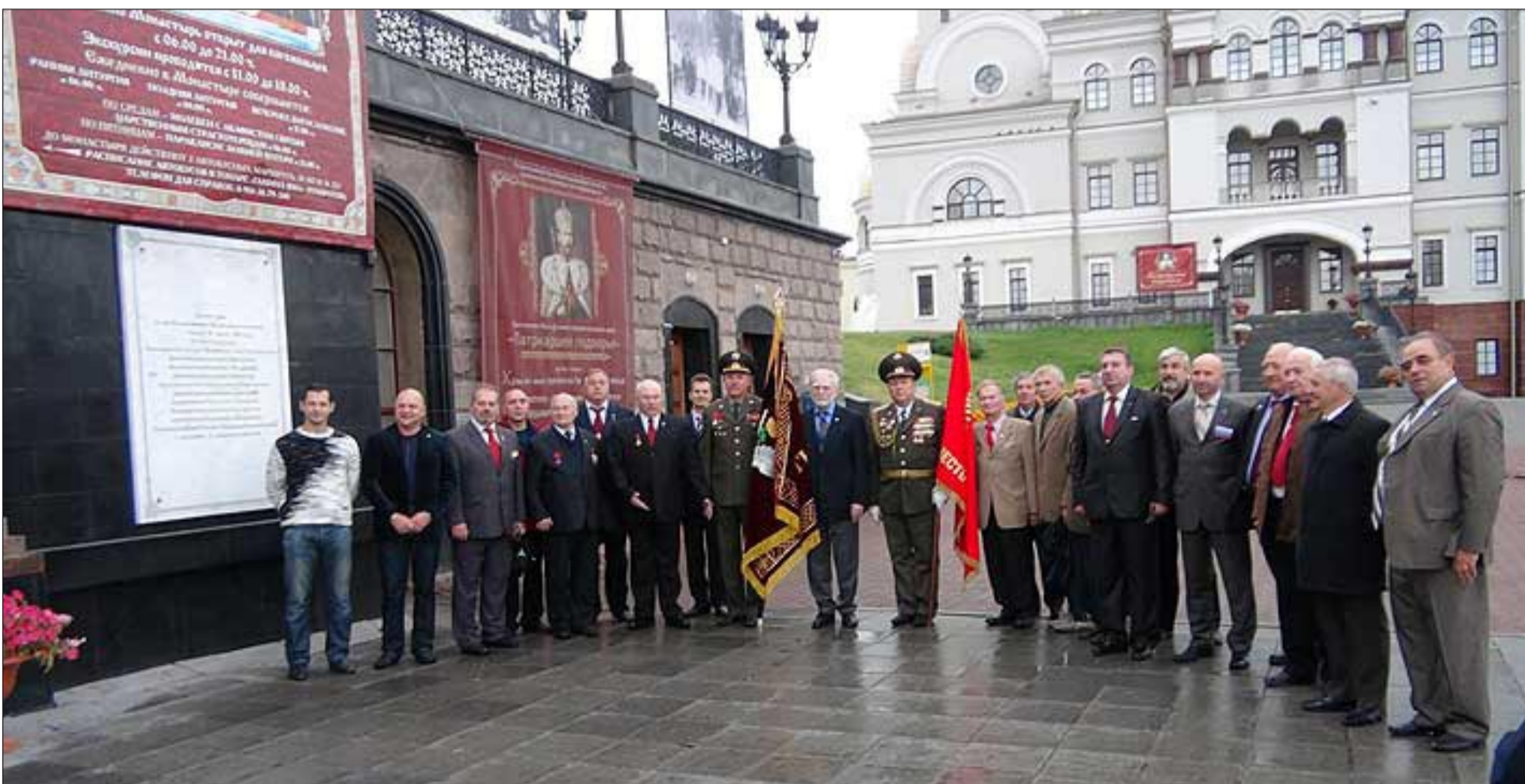
Делегаты III Съезда Открытого Содружества суворовцев, нахимовцев и кадет России перед молебном в Храме-на-Крови, где совершили обряд поминовения семьи Государя-Императора Николая II

В Екатеринбургском суворовском военном училище создана хорошая учебная и материально-техническая база, которая обеспечивает достойные условия учебы и быта суворовцев. Особое внимание уделяется интеллектуальному и эстетическому развитию, посещению театров и музеев, экскурсиям, встречам с писателями, поэтами, артистами.