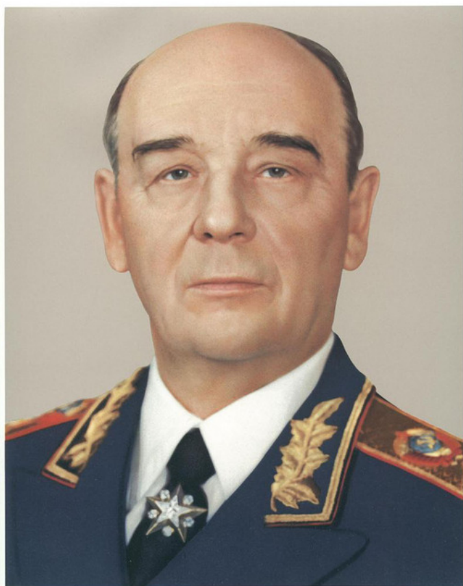
Сергей Леонидович СОКОЛОВ