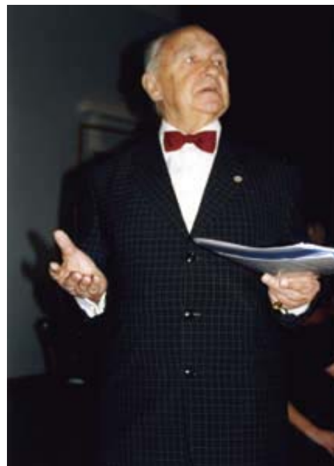
Монолог Эгмонта с симфоническим оркестром