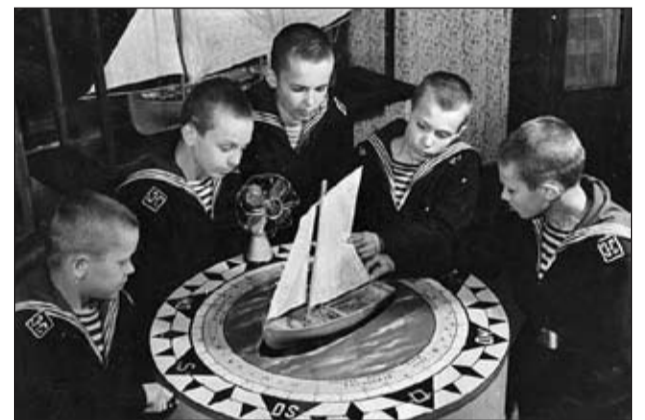
Теоретические занятия по правилам управления шлюпкой под парусами на уроке по военно-морской подготовке