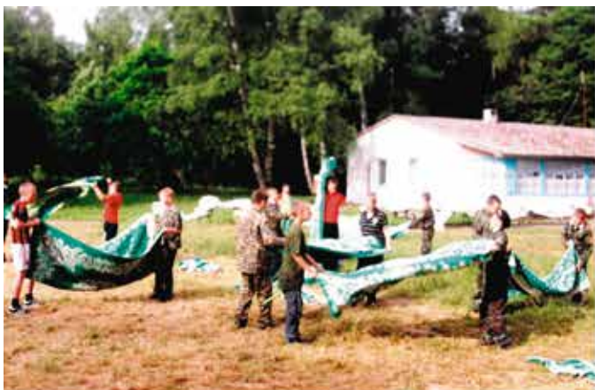
Вытряхивать одеяла — тоже надо научиться.