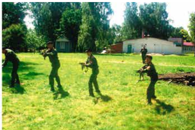
Занятия по рукопашному бою у кадет в особом почете,