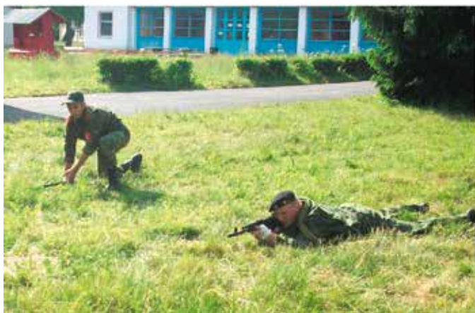
Занятия по тактике. Приемы и способы перемещения военнослужащего на поле боя.

Так как в день открытия лагеря шел проливной дождь, торжество пришлось перенести в клуб.