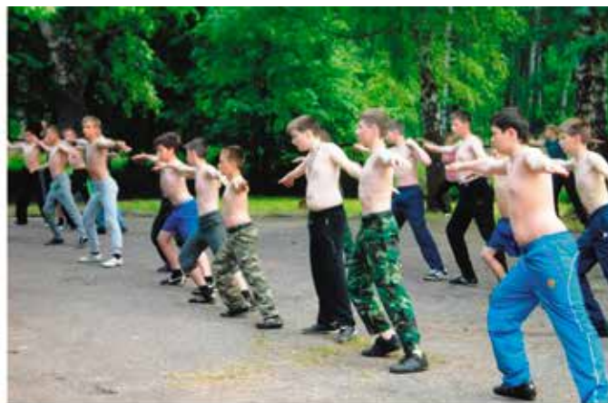
Утро, как и положено, начинается с физической зарядки.

В Калининградском Великого князя Александра Невского кадетском корпусе завершился военно-полевой лагерный сбор. В этом году он проводился на базе Детско-юношеского спортивно-оздоровительного центра имени Валентины Терешковой.