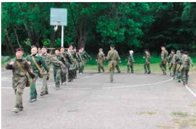
Затем обязательный строевой тренаж (на занятиях 5 класс).