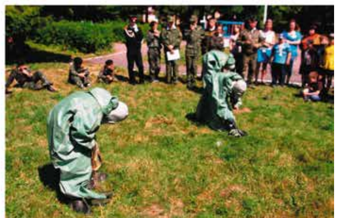
Показные занятия по ЗОМП

Начиная со следующего дня, мы жили строго по военному распорядку: в семь утра подъем, зарядка (пробежка по лесу, выполнение комплекса вольных упражнений). Все это очень бодрило. Потом утренний туалет (с обязательным обтиранием или обливанием холодной водой), заправка постелей, завтрак и до обеда — занятия. После обеда тихий час и еще два часа занятий. Потом ужин и спортивные или культурные мероприятия совместно с гражданским лагерем.