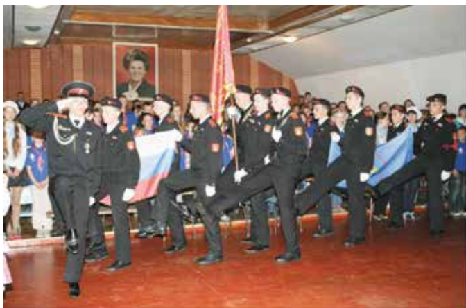
Знаменная группа выносит Флаг Российской Федерации, Знамя Кадетского корпуса и флаг лагеря.