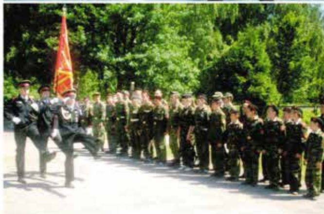
«Под знамя, смирно!» Церемония закрытия военно-полевого сбора.