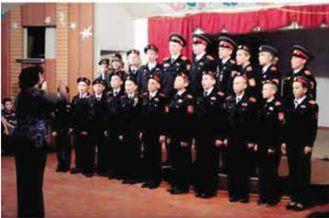
Наш хор пользуется заслуженным успехом, где бы мы ни выступали