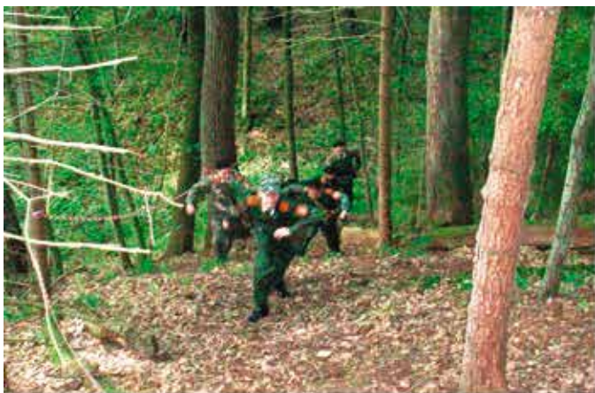
А 7 (8) класс этот же маршрут проходит без оружия.