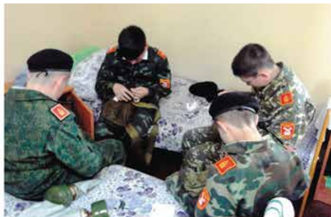
Шить и пришивать тоже надо уметь.

лось остаться в них на ночь, но, к сожалению, пошел сильный дождь и нам не разрешили ночевать в палатках. Обучались мы приемам рукопашного боя с метанием малой пехотной лопатки и ножей. Занимались военной тактикой, совершали марш-броски по полной форме с оружием и противогазами, тяжело было, но мы же будущие солдаты и должны выносить все трудности. Было все очень интересно и познавательно.