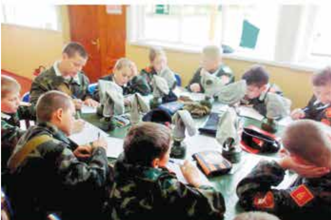
Занятия по военной топографии, но противогазы наготове...

Первый день был полностью посвящён ознакомлению с территорией, распорядком дня и обустройству в казармах.