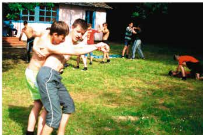
Поэтому они оттачивают свое мастерство даже в свободное время.

Во время военной подготовки мы много занимались и многое узнали. Например, как обращаться с противогазом, тренировка по защите от оружия массового поражения. Было очень смешно и весело когда все надели противогазы и химзащиту. Еще нас учили устанавливать палатки, всем сразу же захоте-