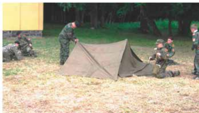
Занятия по инженерной подготовке. Оборудование простейших укрытий из плащ-палаток.