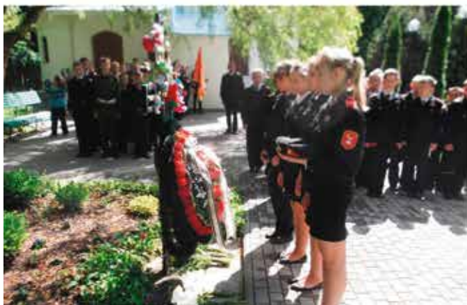
Мы возложили цветы к памяtnому знаку трагически погибшим детям и поставили свечи в часовне на месте гибели детей.