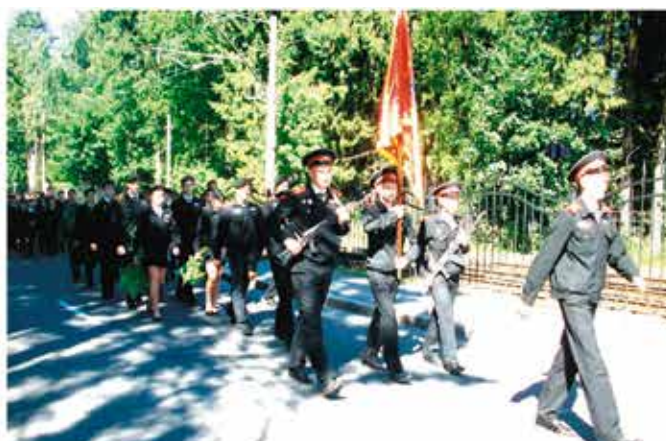
Прохождение по Светлогорску впечатлило не только местных жителей, но и кадет.

Я хорошо отдохнула на стажировке, узнала много интересных вещей. Мне бы очень хотелось поехать на стажировку в следующем году.