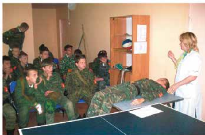
На занятиях по военно-медицинской подготовке.