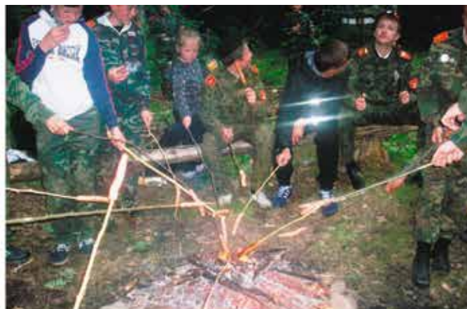
А затем прощальный костер с традиционным поджариванием сосисок...