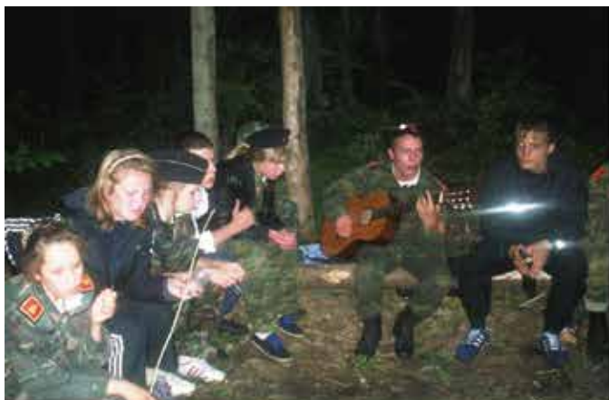
и песни у костра до поздней ночи.