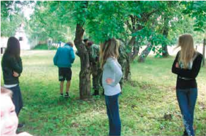
Конечно, как не заглядеться на наших парней!