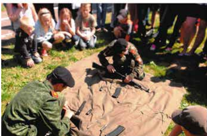
Показные занятия по огневой подготовке