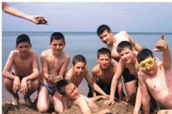
Отдых у моря, что может быть лучше?!