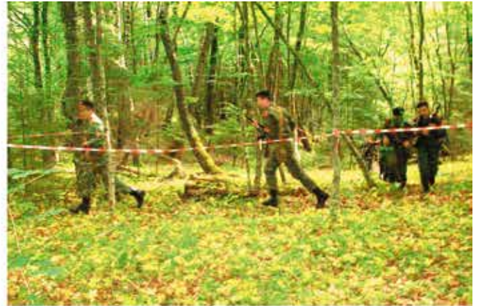
На маршруте марш-броска 8 (9) класс с оружием и противогазами