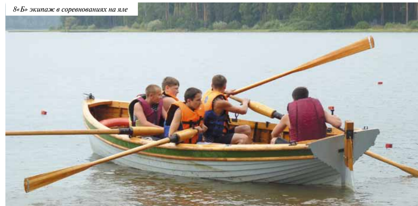
8«Б» экипаж в соревнованиях на яле

Вот такое начало учебного года. Удачи вам кадеты. Будьте доблестными гражданами своей Родины.