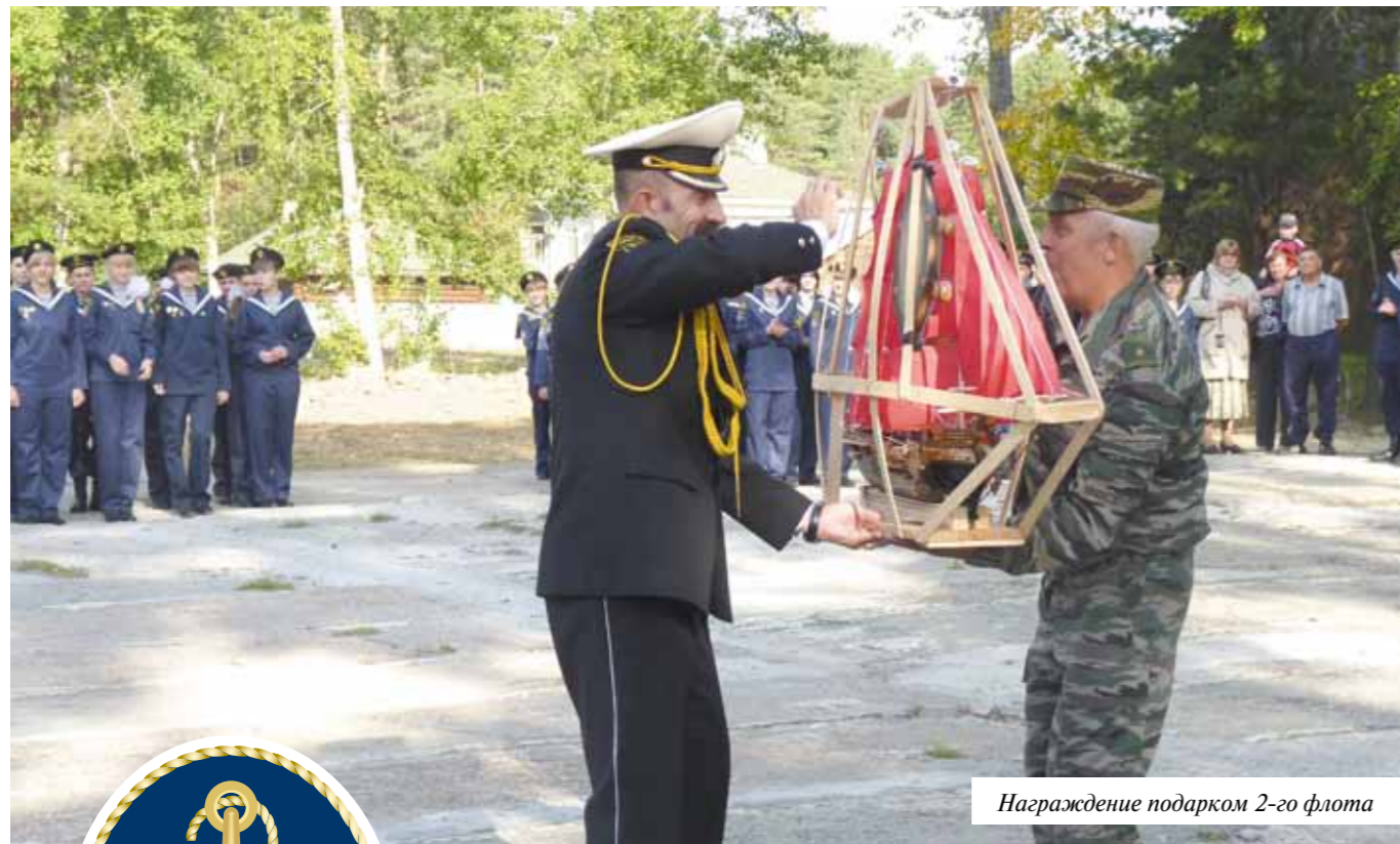
Награждение подарком 2-го флота