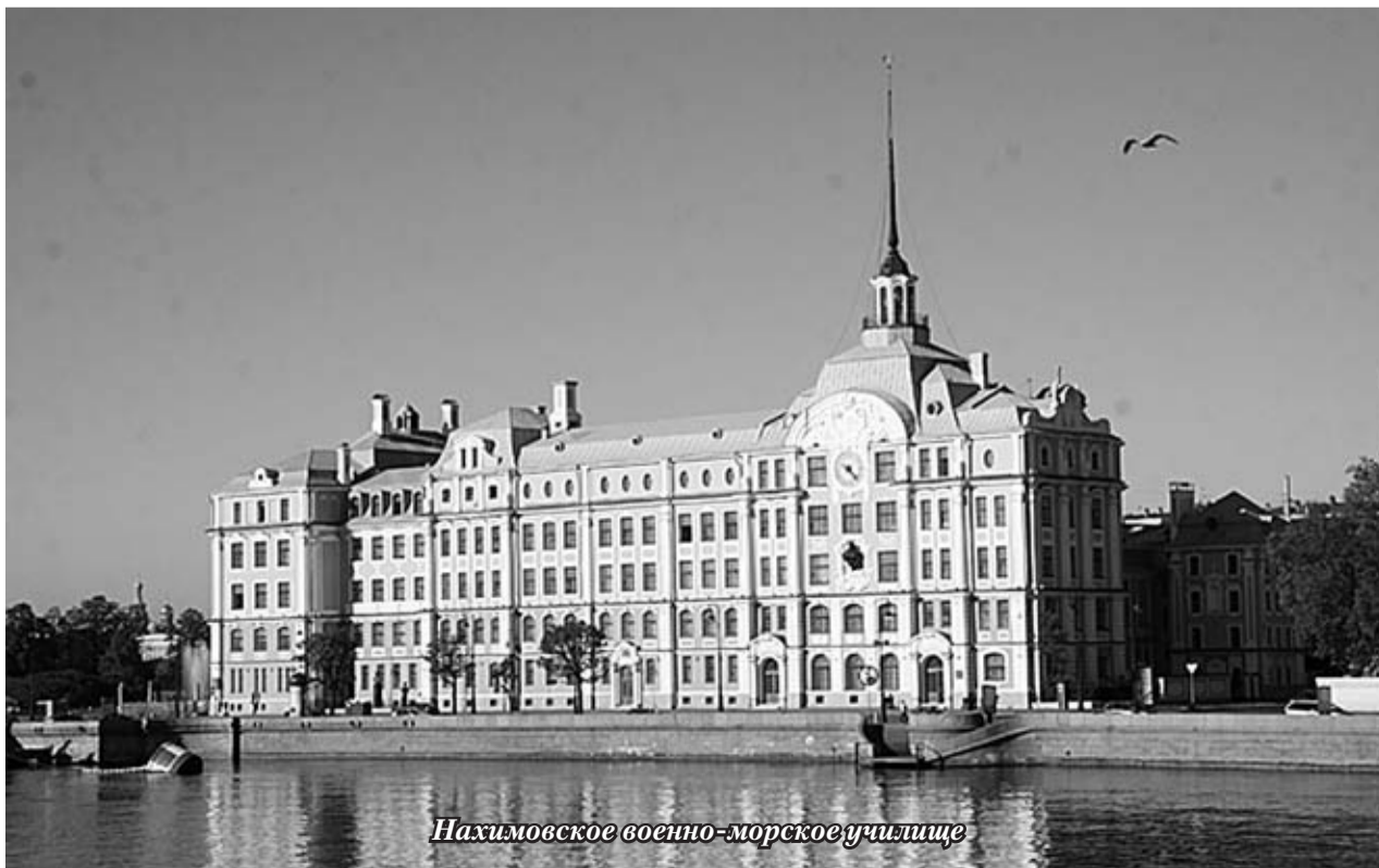
Нахимовское военно-морское училище

На редких фотографиях 40-х смотрят в мир ребята, мои ровесники в морской форме. Как же они были молоды, дети-юнги, с Валаамской школы боцманов, вынесшие непомерную тяжесть войны. «Я считаю, что молодежь принесла главную жертву войне, — это слова Г.К. Жукова. — С командного пункта я много раз наблюдал, как молодые солдаты поднимались в атаку. Это страшная минута: подняться в рост, когда смертоносным металлом пронизан воздух». Из этих страшных минут сложилась волнующая биография поколения, которое мы с гордостью называем — огненное! Поколение, которому планета обязана счастьем и мирной весной сорок пятого года!