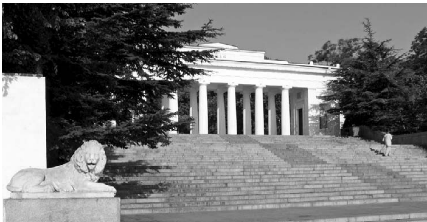
Графская пристань. Севастополь