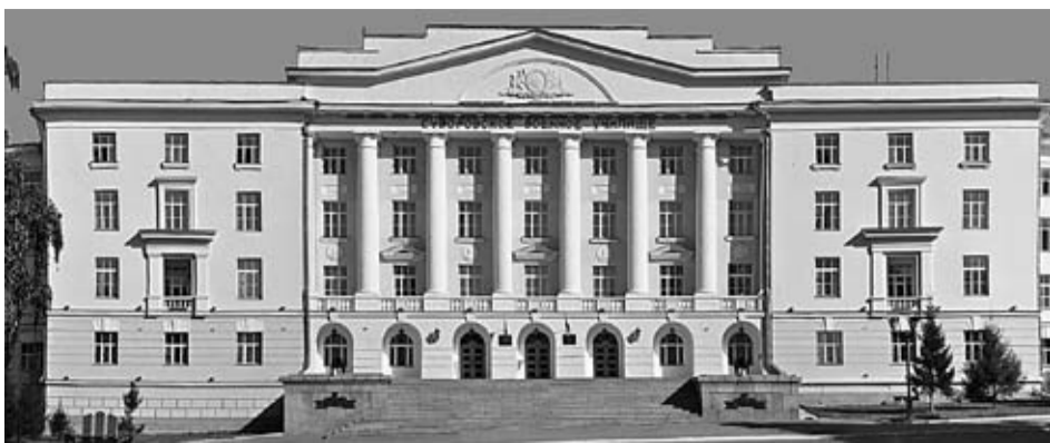
Екатеринбургское суворовское военное училище

Эта память, верьте, люди, Всей Земле нужна!