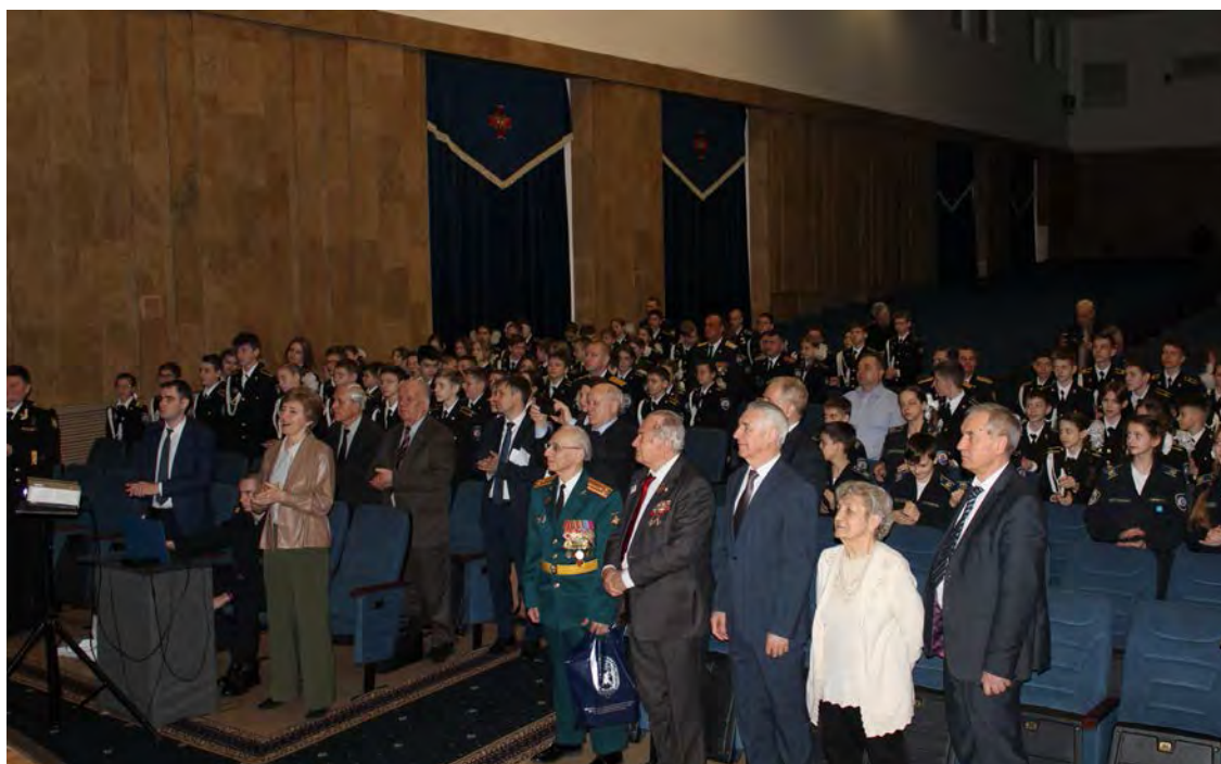
Зал подпевал стоя.

Завершал программу вечера «Марш кадетского единства», написанный Владимиром Проскурным на слова Б. Нестеренко, прозвучавший на этот раз в исполнении всех участников концерта. Зал подпевал стоя.