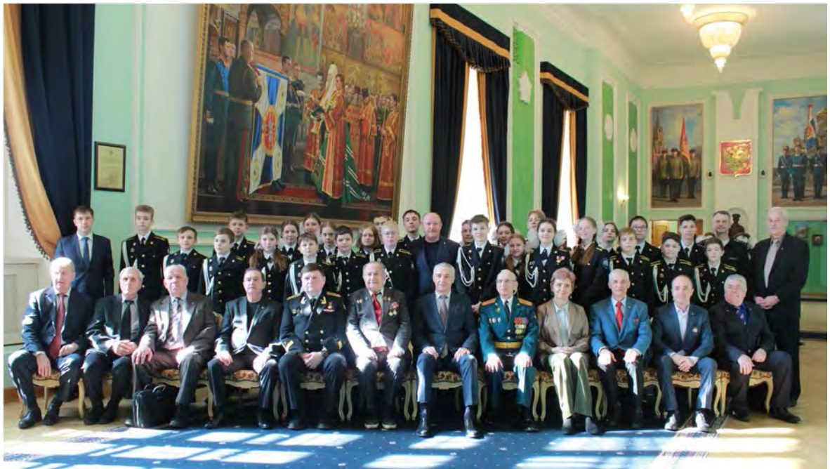
Фотография на память в клубе Кремлевского полка с одним из присутствовавших кадетских классов Федеральной Службы Охраны

Для нас, участников проекта «Кадетское наследие», это стало запоминающимся событием в исторических стенах сердца нашей Родины Московского Кремля