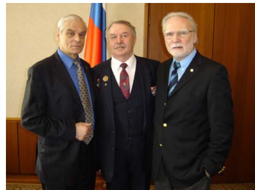
В. Е. Аниканов (в центре) с выпускниками суворовских военных училищ: народным артистом России Г. В. Васильевым (слева) – Горьковское СВУ и академиком В. Г. Кадашевским (Свердловское СВУ). Апрель 2007 г.